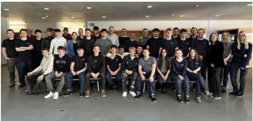
Das gesamte Team bei der Präsentation

über das gelungene Ergebnis war groß – und der Stolz der Lehrlinge mindestens genauso.