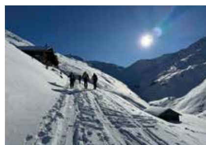
Perfekte Bedingungen beim Praxisteil