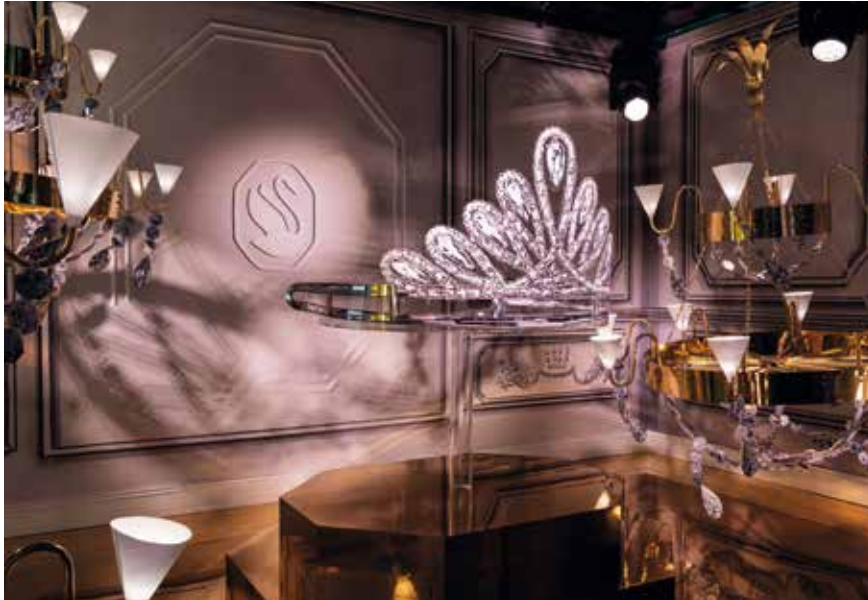
Die neue Kunstbühne im Kristallwelten Store Wien

Am 17. Januar 2025 wurde in Wien die ikonische Tiara des Wiener Opernballs 2025 enthüllt, die seit 1965 die Debütantinnen schmückt. Die funkelnde Tradition ist ein Symbol österreichischen Kulturerbes und steht für das einzigartige Savoir-faire, das Swarovski seit 130 Jahren auszeichnet. Dieses Jahr wird die Tiara