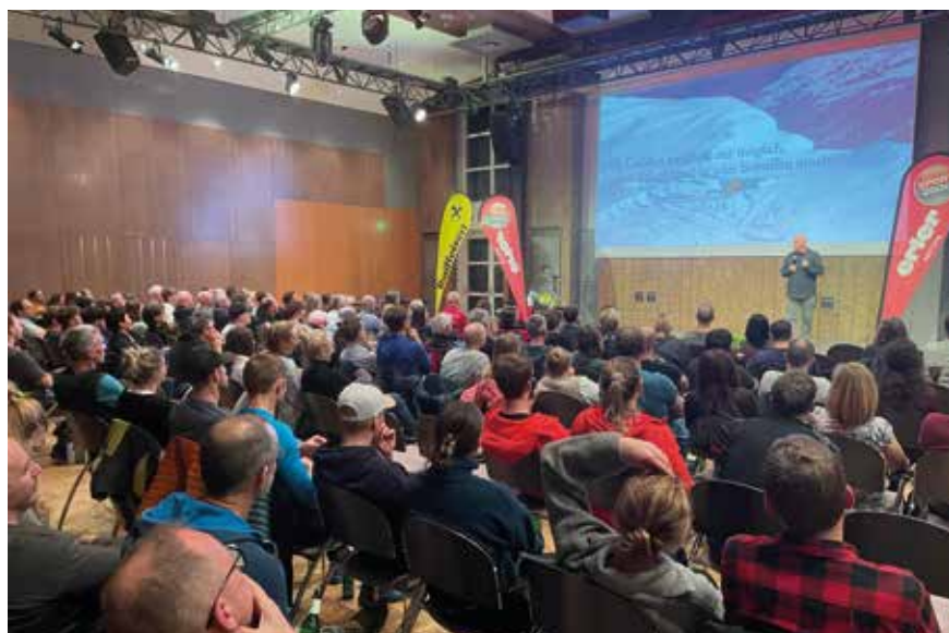
Der Theorieabend im Haus Marie war wieder gut besucht

Am Theorieabend konnten rund 180 Teilnehmer begrüßt werden. Exper-