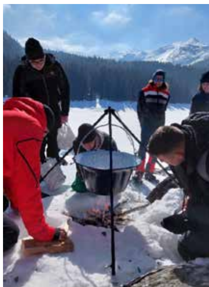
Stärkung des Teams durch gemeinsames Kochen in freier Wildnis (Lehrlinge 2. Lehrjahr)