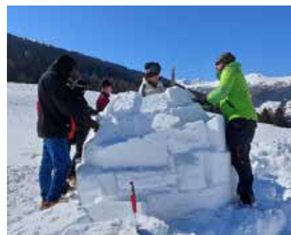
Förderung der Kommunikation beim gemeinsamen Iglubau (Lehrlinge 2. Lehrjahr)

Gleichzeitig waren die Tage mit Spaß, Bewegung und etwas Action versehen, sodass sich die Lehrlinge hoffentlich noch lange daran erinnern werden.