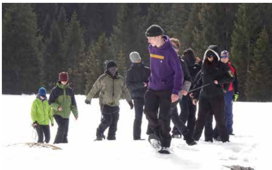
Blind vertrauen durften sich die Lehrlinge des 1. Lehrjahrs bei ihren ersten Erlebnistagen

Das Ziel des dreitägigen Seminars war es, die Lehrlinge als Team zu unterstützen, sich gegenseitig zu vertrauen, die gemeinsame Kommunikation zu verbessern und Stärken hervorzuheben. Dadurch soll die Motivation und Teamfähigkeit für den Arbeitsalltag gestärkt werden.